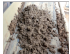
上：SPATON脱水機 全体① (パッケージ型) 2段目：SPATON脱水機 全体② 3段目：混和槽 下：脱水ケーキ