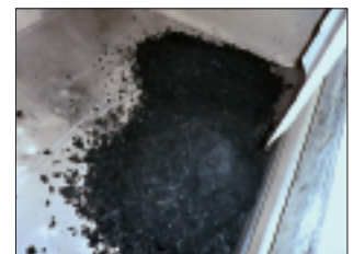
上：SPATON脱水機 全体 (パッケージ型) 2段目：脱水ケーキ排出口 3段目：混和槽 下：脱水ケーキ