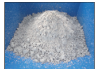
上：SPATON脱水機 全体 2段目：脱水ケーキ排出口 3段目：混和槽 下：脱水ケーキ