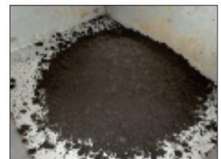
上：SPATON脱水機 全体 (濃縮機内蔵型 2Drive機構) 2段目：脱水ケーキ排出口 3段目：混和槽 下：脱水ケーキ